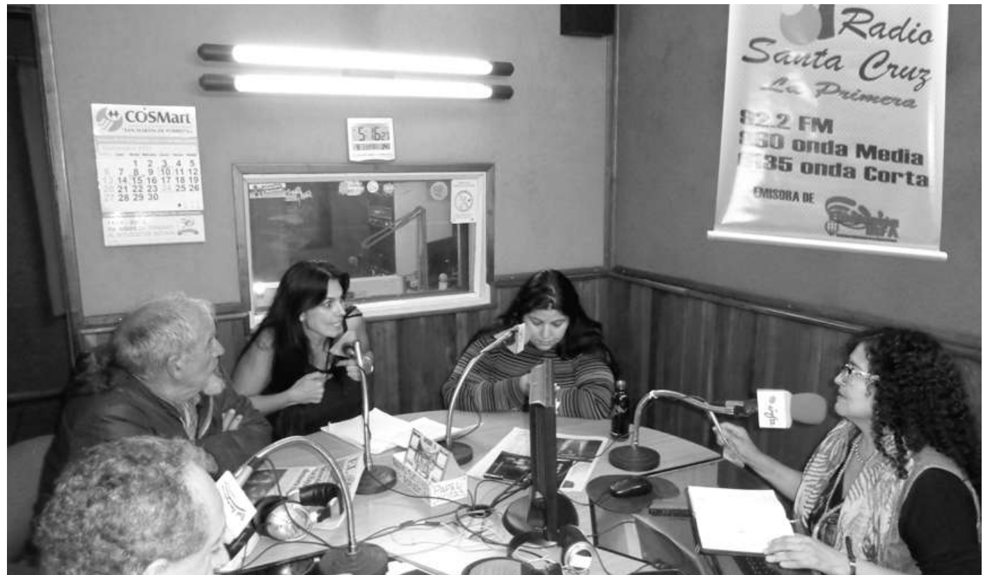
Programa "La Otra Cara" - Radio Santa Cruz

“El mundo exige el fin del bloqueo a Cuba. Cada vez EEUU está más aislado por sus políticas erráticas, cada vez más los pueblos están despertando. El 99 % del mundo condena el bloqueo económico, EEUU e Israel se opusieron, pero no hablemos de dos países, sino de una sola política, porque para que se llegue a ser presidente de los EEUU hay que pasar por el lobby israelí en EEUU, ellos son los que manejan los negocios en el mundo (Oswaldo Chato Peredo)”