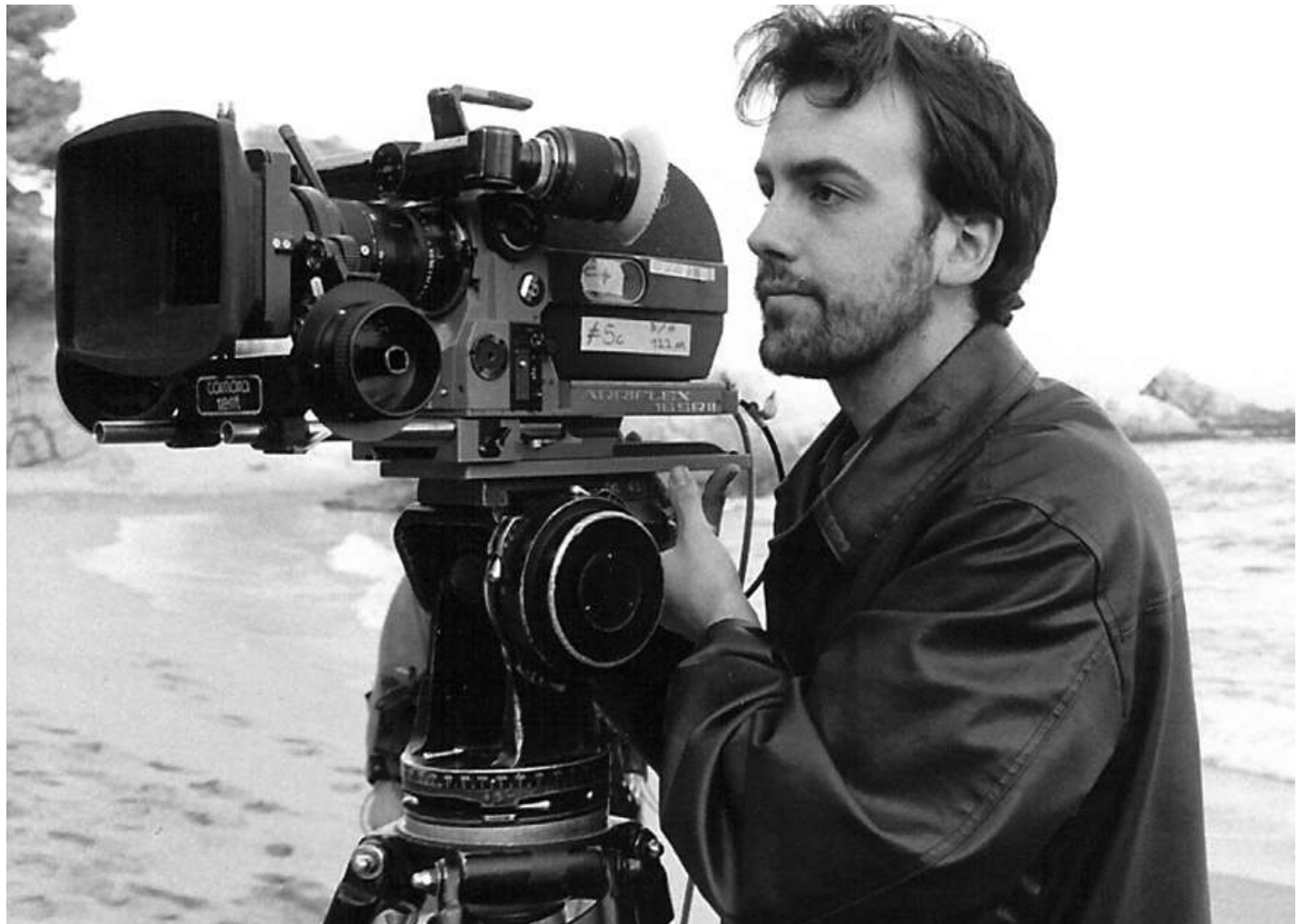
Isaki Lacuesta, director de cine

Isaki Lacuesta presenta una sátira social en la que cinco ciudadanos normales y corrientes, de un país extrañamente parecido a España, ven destrozadas sus vidas por la crisis (estafa) económica. Sin nada ya que perder, elaboran un enloquecido plan para salvar la economía española y la