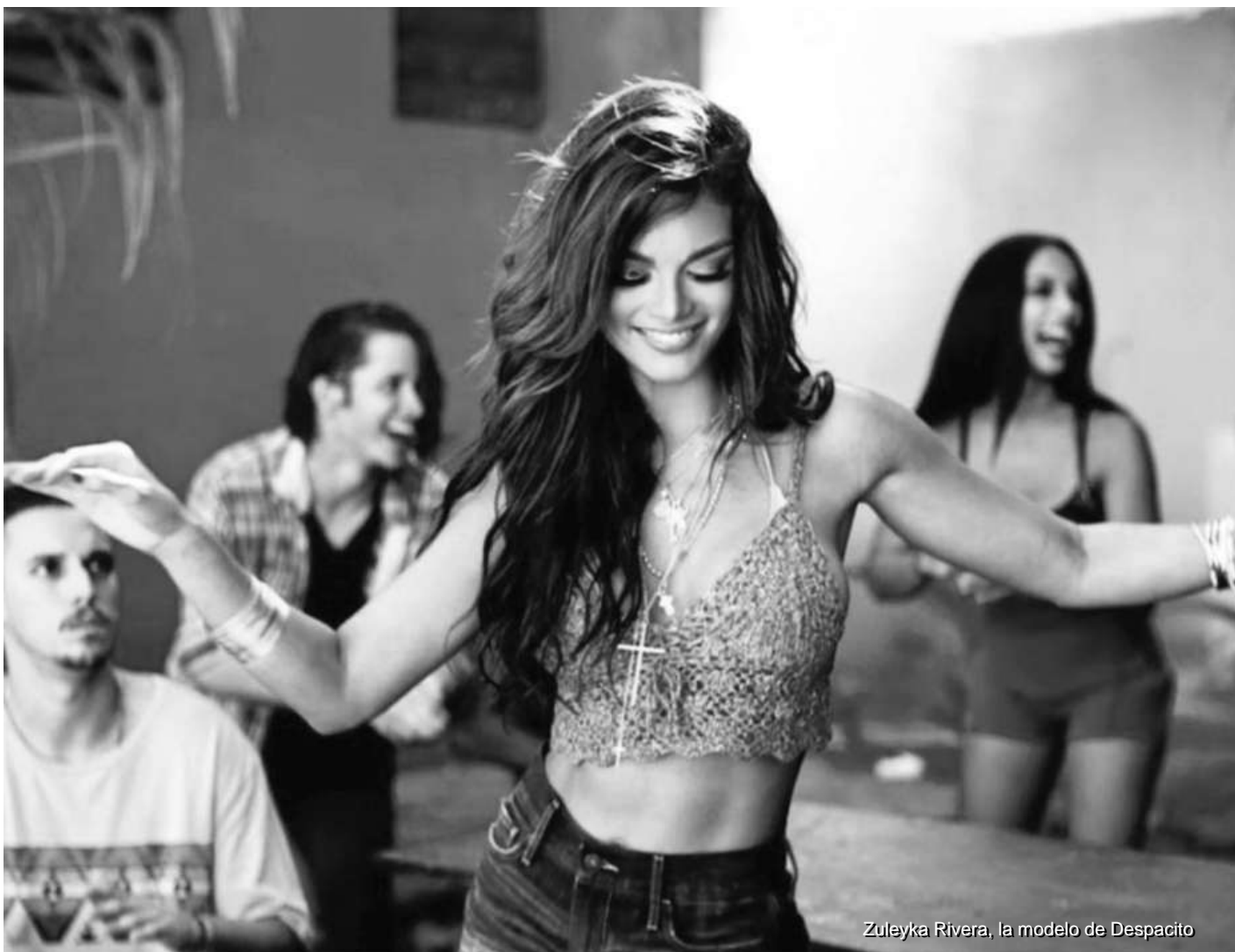
Zuleyka Rivera, la modelo de Despacito

Nuevas píldoras de adormecimiento y retraso de la conciencia colectiva son suministrados a diario por los ideólogos de la tan promocionada globalización mundial, un proyecto macabro que busca entre otras cosas imponer su modelo de cultura dominante, masificar y uniformizar en serie a la raza humana. ■