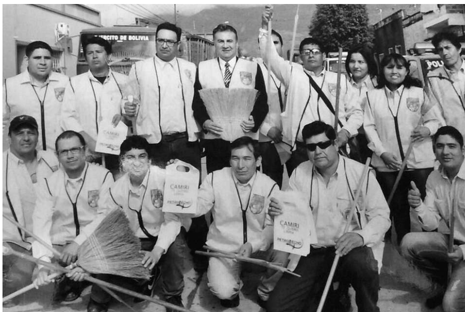
Equipo técnico del GAMC programa escoba

plica cómo un acrónimo en la gramática, cuyo significado es: "Ejército Contra la Basura"; a través del cual se pretende promover a la conciencia de la población y todos los seres humanos por la limpieza de sus zonas, barrios, unidades vecinales, y en sus propias viviendas, colocar la basura en su respectivo lugar, no ensuciar nuestra ciudad, estimular y fijar en el subconsciente de nuestras actuales y nuevas generaciones el sentido de ciudad limpia, no botar la basura en cualquier lugar, llevarlos en lo posible en nuestros bolsillos hasta que encontremos un basurero en el cual podamos depositarlos; el mencionado profesional es un convencido con esta idea de que en el futuro se puede llegar a tener una ciudad limpia con el simple hecho de acostumbrarnos a no ensuciar nuestra ciudad, y con esa acción como es lógico suponer, no vamos a necesitar hacer campañas de limpieza, nos menciona una ciudad del vecino país Paraguay denominada Atyrará, con la práctica constante de sus habitantes, llegó a convertirse en una de las ciudades más limpias del mundo, certificado por la OMS/OPS. Finalmente podemos recordar el dicho popular que viene a propósito escrito al principio de este artículo: "El mejor Plaguicida es la limpieza". ■