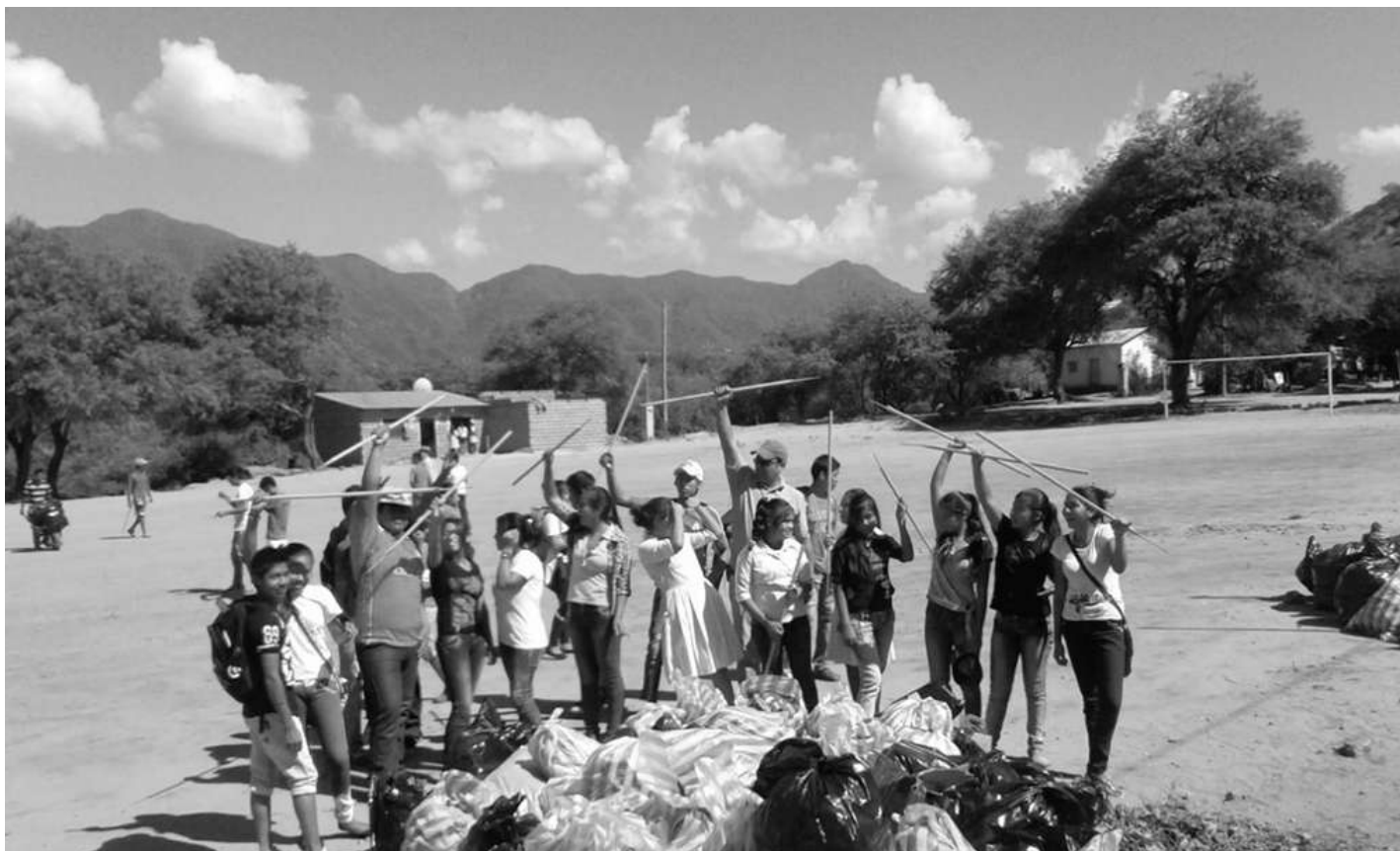
Unidad Educativa de una comunidad después de una campaña de limpieza

El fumigado para el control consiste, en la aplicación de órgano fosforados al 1.5 % de concentración, que es un porcentaje permitido por la