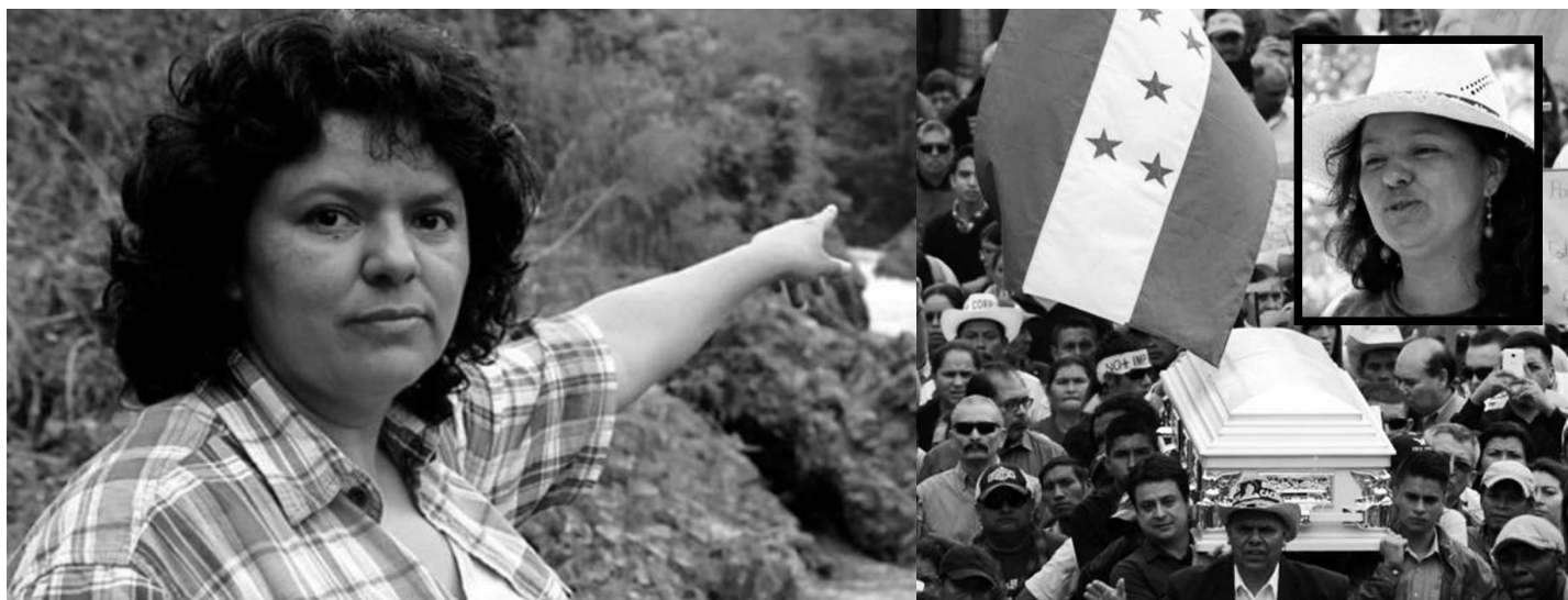
Berta Cáceres, líder indígena lenca, asesinada el 3 de marzo 2016 en Honduras