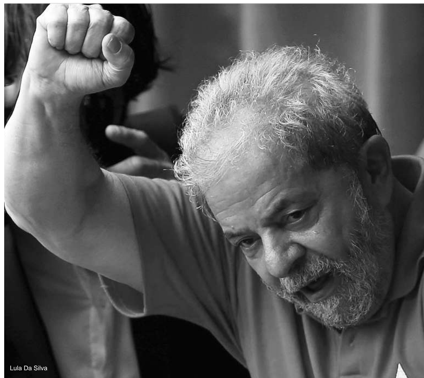
Lula Da Silva

Puede alguien creer que esta puesta en escena se halla descontextuada del clima subversivo y destituyente que