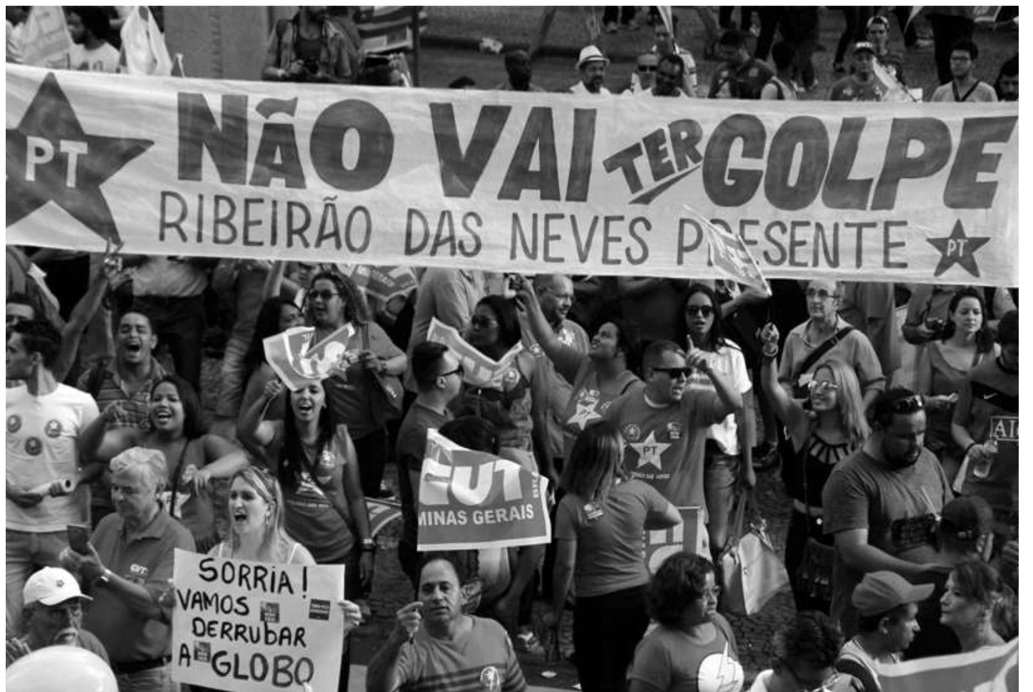
La clase obrera, campesina y proletaria en las calles de Brasil.

En resumen pues, lo que está viviendo en estos momentos Suramérica es el resultado de la excelente logística de la guerra sucia en cada país. Sin recurrir a dictaduras sangrientas como en décadas anteriores han logrado a través de polarización de los medios de comunicación; lavar cerebros y arrancar de tajo el débil criterio de la