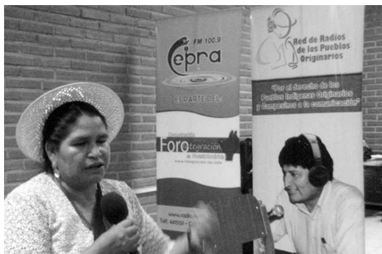
Radios comunitarias y Radios de Pueblos Originarios, con una cobertura especial desde Tiquipaya

Hablemos ahora de la nueva faceta de las guerras desatadas por las potencias mundiales. Nos viene a la mente la famosa frase del Libertador Simón Bolívar, quien hace dos siglos ya pronosticó: "Los Estados Unidos parecen destinados por la Providencia para plagar la América de miseria a nombre de la libertad." Se equivocó solamente en una cosa: EEUU plagó no sólo a América, sino al mundo entero.