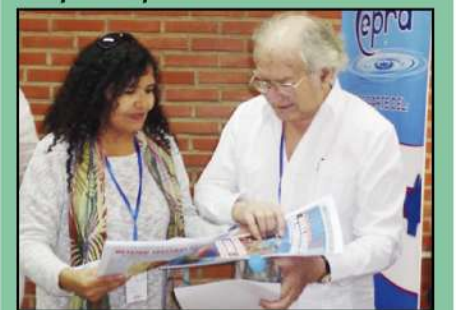
Visión - Z

Mi encuentro con Adolfo Pérez Esquivel, premio Nobel de la Paz