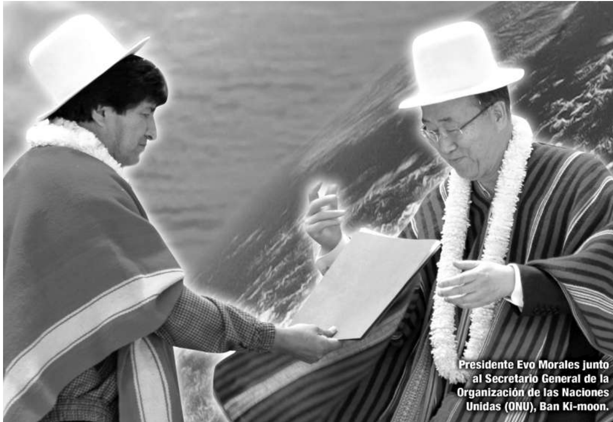
Presidente Evo Morales junto al Secretario General de la Organización de las Naciones Unidas (ONU), Ban Ki-moon.

Mar para los pueblos: Agradecemos la declaración de la Mesa No. 6, que plantea impulsar el acceso soberano al mar del pueblo boliviano, apoyando la demanda marítima en la Corte Internacional de la Haya para generar el espacio de diálogo que resuelva los temas pendientes entre los hermanos países de Bolivia y Chile.