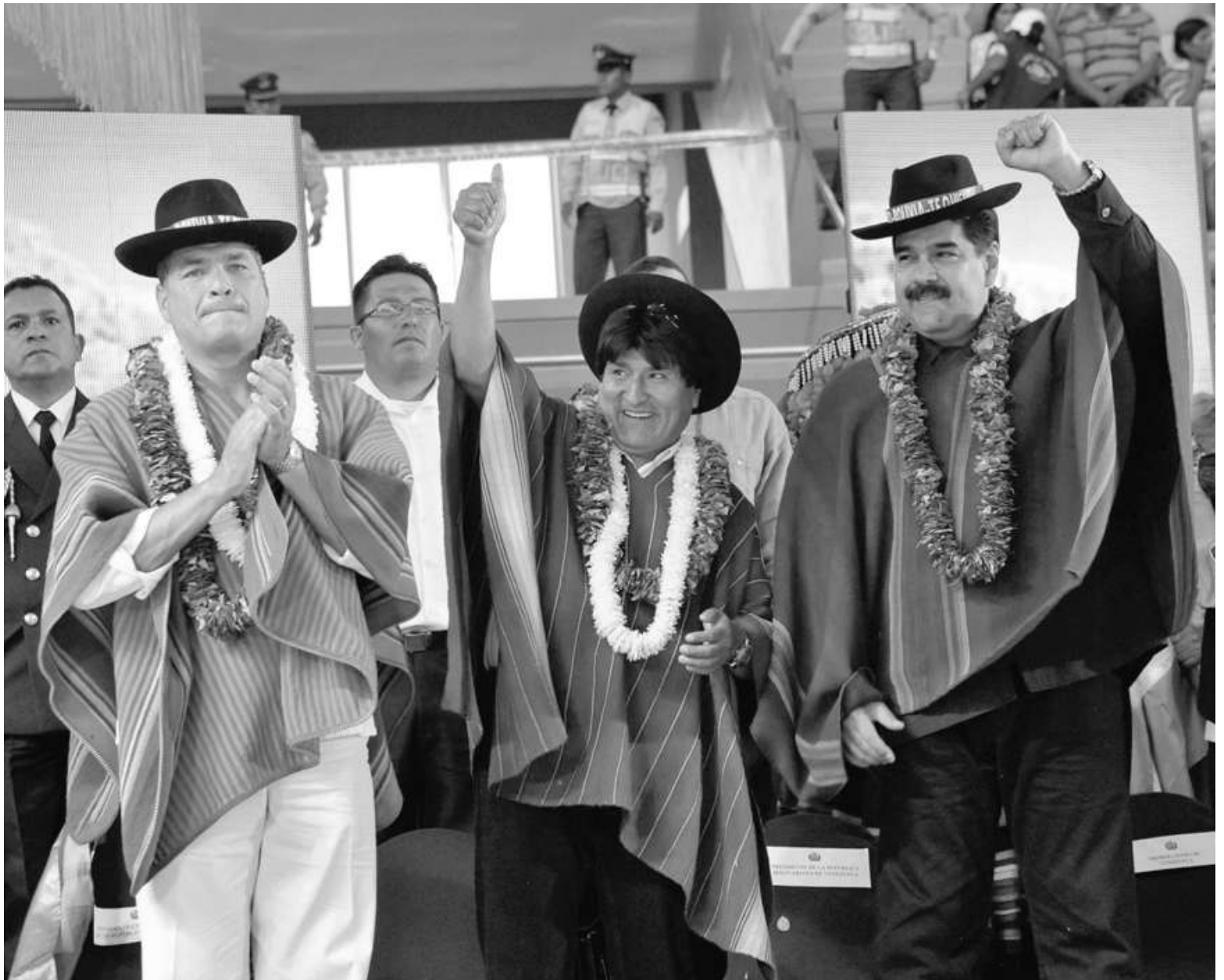
Rafael Correa (Ecuador) Evo Morales (Bolivia) Nicolás Maduro (Venezuela) en la II Conferencia Mundial de los Pueblos sobre Cambio Climático y Defensa de la Vida en Bolivia

Hablamos de las empresas transnacionales, que en su afán de controlar los recursos naturales del planeta no escatiman métodos, desde la compra de conciencias hasta el uso de mercenarios y armas. Pese a los estragos medio ambientales causados por estas empresas, nunca son sentenciadas porque reciben la protección de los organismos internacionales, que a su vez obedecen a las