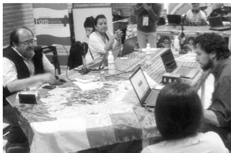
Radios comunitarias y Radios de Pueblos Originarios