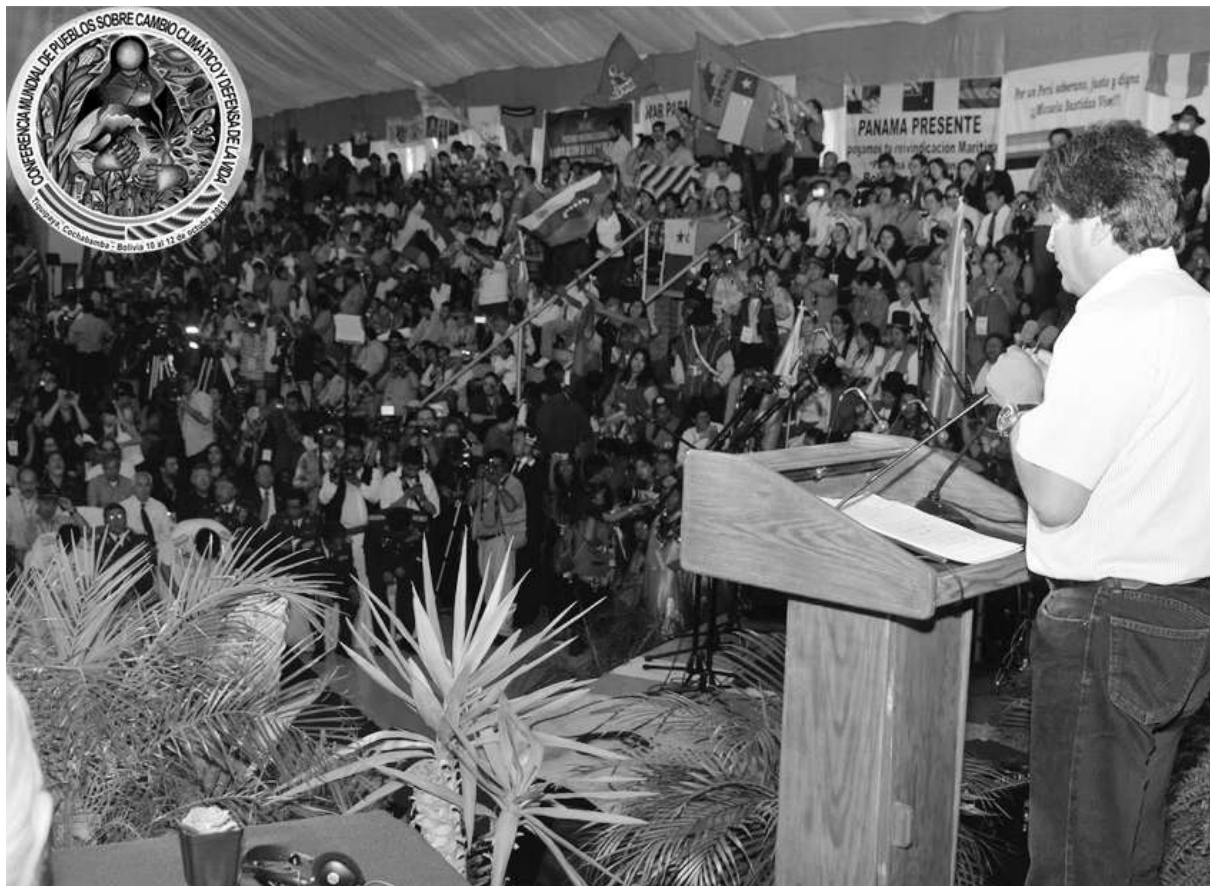
Evo Morales, inaugura conferencia mundial de los pueblos sobre el cambio climático y defensa de la vida

"SÓLO CUANDO EL ÚLTIMO ÁRBOL ESTÉ MUERTO, EL ÚLTIMO RÍO ESTÉ ENVENENADO Y EL ÚLTIMO PEZ SEA PESCADO NOS DAREMOS CUENTA DE QUE NO PODEMOS COMER DINERO"