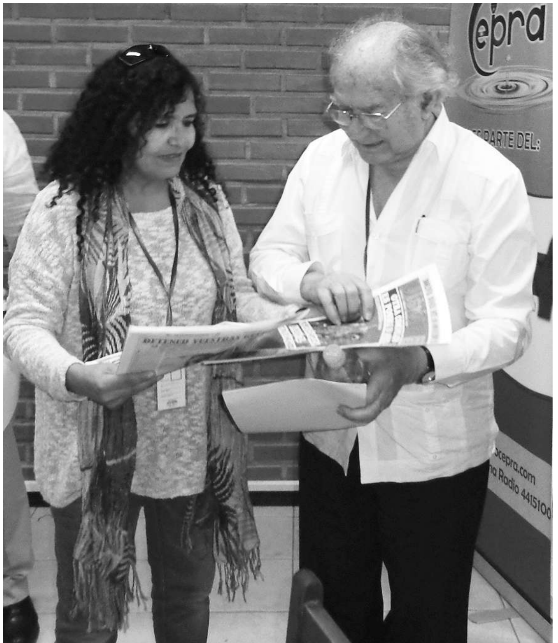
María Eugenia Claros y Adolfo Pérez Esquivel

"El Siglo XXI enfrenta a la humanidad con grandes desafíos de defender y resguardar la Vida, amenazada por los grandes intereses económicos y políticos, donde una minoría poderosa privilegia el capital financiero sobre la vida de los pueblos. Son aquellos que saben el precio de todas las cosas y el valor de ninguno, ignoran que precio y valor no son lo mismo. El desafío fundamental está en manos de los pueblos que se asuman